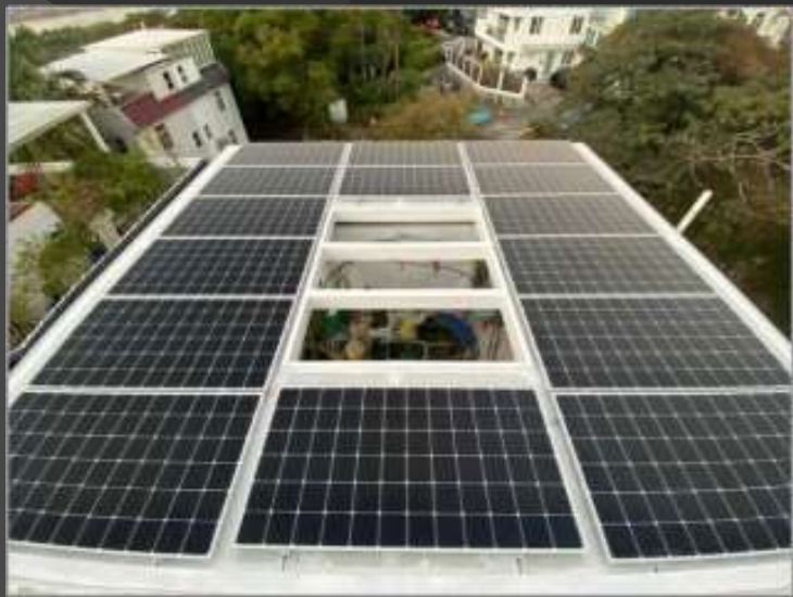
太陽能租用天台服務